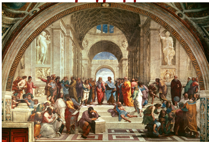
Raphael's fresco. The School of Athens (1510-11)

Όλες οι ομιλίες γίνονται από Καθηγητές του ΑΠΘ και από ειδικούς ιατρούς με τους συνεργάτες τους, αφορούν τις πιο σύγχρονες διαγνωστικές και θεραπευτικές γνώσεις, που έχουν πρακτικό ενδιαφέρον τόσο για τους συναδέλφους ιατρούς, όσο και για άτομα που σχετίζονται με την ιατρική γνώση. Στο Πρόγραμμα αναφέρονται 2 ερωτήσεις στις οποίες θα απαντήσουν οι ομιλητές. Θα υπάρχει συζήτηση μετά από κάθε ομιλία. Ευρεία περίληψη ή το κείμενο της ομιλίας με τις σχετικές διαφάνειες θα δημοσιευθούν και θα διανεμηθούν στους συμμετέχοντες συναδέλφους. Στις ομιλίες θα περιλαμβάνονται γενικότερα, μέρη της Αριστοτελικής διδασκαλίας.